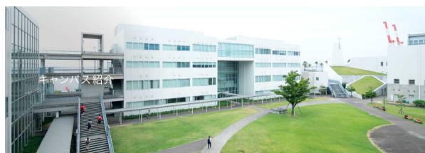
神戸国際大学（大学Hpより）

6月1日（木）～3日（土）に、神戸の八代学院神戸国際大学で開かれた、キリスト教学校教育同盟の総会と理事会に参加してきました。総会初日は、大変な嵐で、朝からずぶ濡れになりながら会場にたどりつきました。