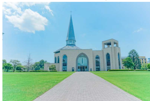
青学相模原キャンパス礼拝堂