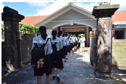
ひめゆり平和祈念資料館