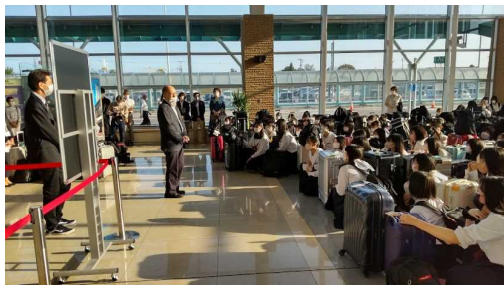
1日目：出発式（函館空港）

生徒の皆さん一人一人の自覚、保護者の方々のご配慮、沖縄の観光バスの乗務員の方々、ガイドの方々、ホテル・観光施設・お店のスタッフの皆さんの感染対策、高2学年団・日本旅行函館支店様の周到的な準備が功を奏して、本当に素晴らしい修学旅行になりました。心から感謝申し上げます。写真で旅行を振り返ってみます。4日目の自主研修の最後にスクールでずぶ濡れになりましたが、天気は5日間好天に恵まれました。