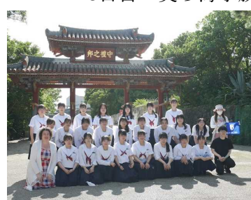
4日目：首里城守礼門