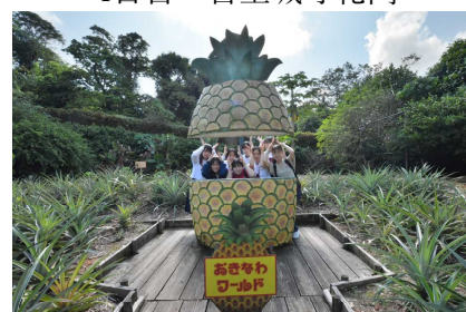
最終日：沖縄ワールド 2022年10月8日（土）