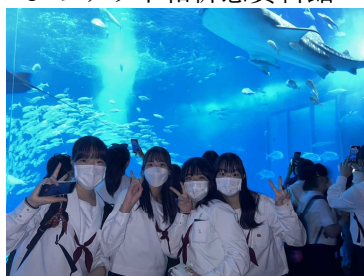
ジンベイザメと5ショット