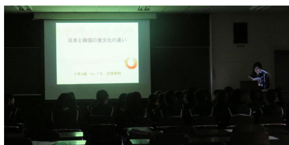
ライト館 301・2でのプレゼン